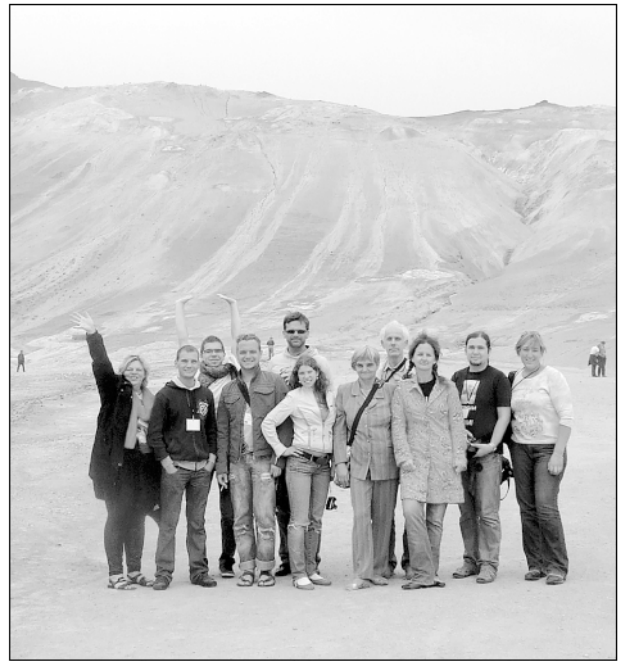
Kopēja bilde, lai neaizmirstos skarbā, bet apbrīnojamā Īslandes ainavā